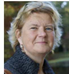
Marjolein de Wit Website